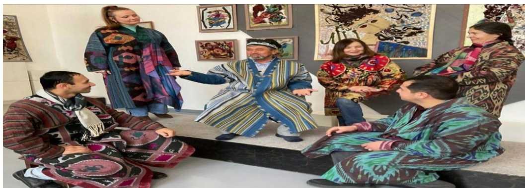
Рис. 6 Пример модернизированной узбекской национальной одежды, созданной художниками и модельерами галереи «Айсель»

Все костюмы, созданные этой творческой группой художников и модельеров являются коллекционным эксклюзивом потому что, повтор и дубль практически невозможен. Даже если и можно повторить крой изделия, то декор и цвет ткани неповторимы.