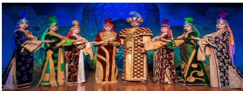
Рис. 3 Пример узбекской национальной одежды, представленный Театром Исторического Костюма - «Эл Мероси».

Во время представления перед зрителями оживают все важные страницы бурной истории. Посетителей также ждёт буйство красок и образов манящего Востока, великолепные костюмы, одухотворяющая музыка и хореография, благодаря чему получится с легкостью погрузиться в водоворот древней и богатой Истории Узбекистана. Например, в одном из самых популярных спектаклей - «По Шёлковому пути», где демонстрация костюмов дополняется хореографией, вниманию публики представлены образы древних скифов - саков и массагетов, огнепоклонников, персидских и согдийских правителей и знати, большая коллекция красочных костюмов эпохи Тимуридов, а также костюмы различных регионов Узбекистана.