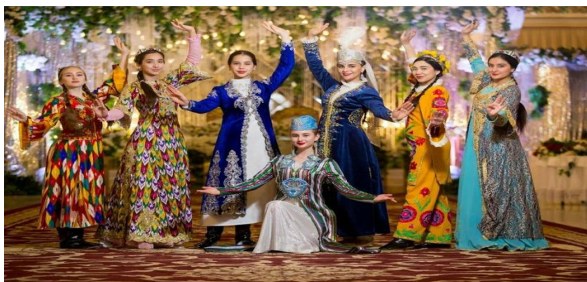
Рис. 4 Пример женской праздничной узбекской национальной одежды, представленной Театром Исторического Костюма - «Эл Мероси».

Еще одна организация, которая помогает узбекскому костюму продолжать свое развитие в сфере искусства и моды – это расположенная в городе Самарканде галерея «Айсель». Она проводит свои гастрольные вернисажи и участвует в конкурсах и международных фэшн-проектах по всему миру, а именно: в Москве, Казани, Новосибирске, Алматы, Перми, Ташкенте, Екатеринбурге, Верноне (Франция), Санкт-Петербурге, Самарканде, Калининграде, Астане.