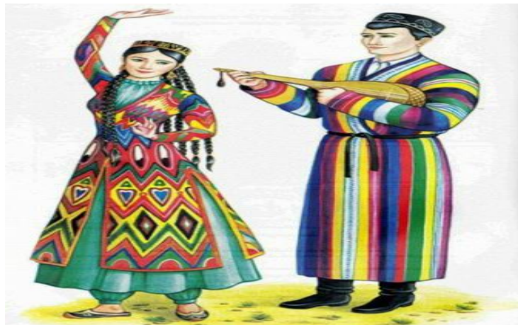
Рис 2. Пример классического варианта узбекской национальной одежды

Так, например женский комплект одежды включает в себя платье-тунику и шаровары. Голову женщины покрывают платком, чапаном или надевают тюбетейку.