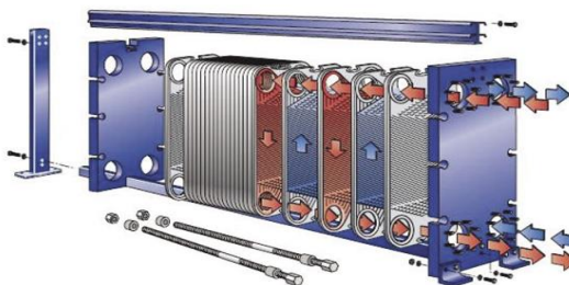
Рис. 2. Пластинчатый теплообменник [5]

Современные пластинчатые теплообменники [5] (рис. 2) состоят из набора пластин. Среда в них движется между пластинами. Такие теплообменники просты в изготовлении (штампованные пластины с прокладками между ними складываются в пакет пластин), легко модифицируются, характеризуются хорошей эффективностью.