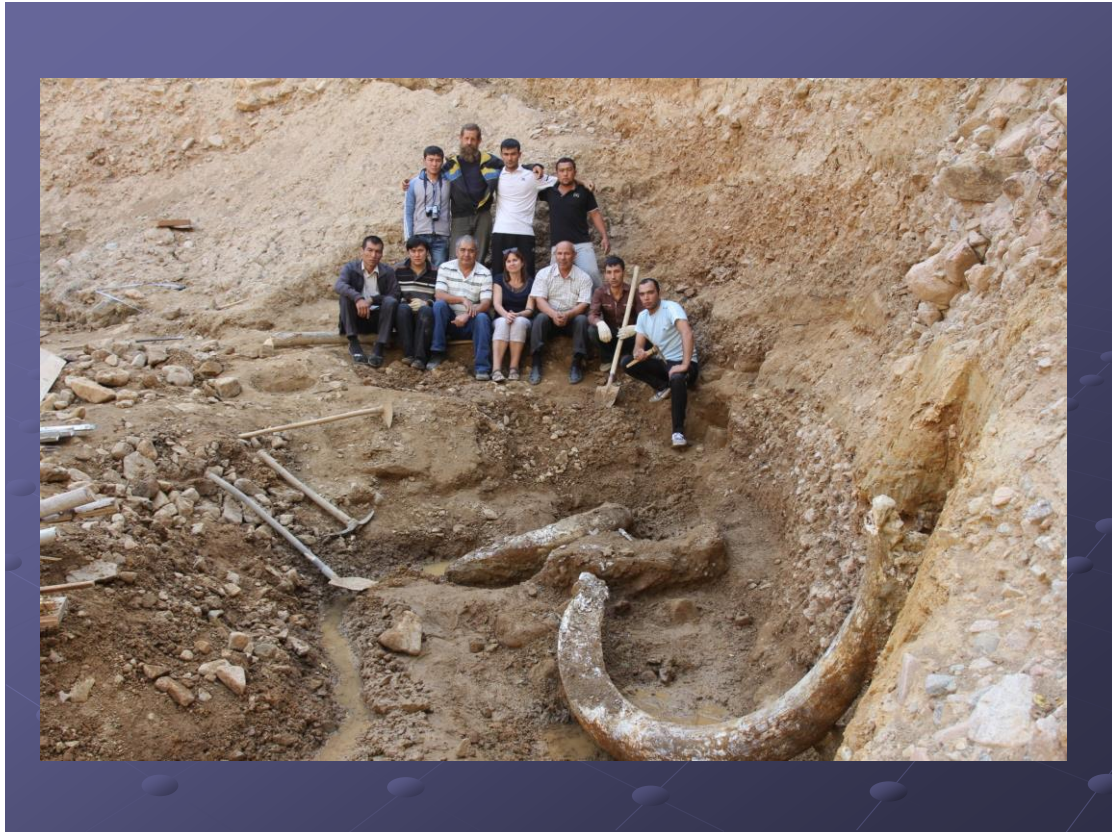
Рис. 1. Горизонты раннего антропогена с погребением мамонта

палеогеографического формирования природной среды. Изучены культурные горизонты памятников палеолита Кольбулак 62 , Кызылалма, Ташсай и стоянкой Обжасай, в стратифицированных отложениях которой наряду с каменными артефактами раннего палеолита были открыты костные останки южного мамонта и других видов животных 63 .