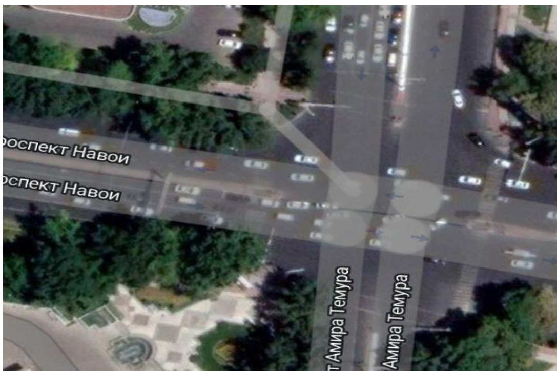
2-расм. А.Темур, А.Навоий ва Шаҳрисабз кўчалари кесиммасининг сунъий йўлдош (спутник)дан олинган фотолавҳаси.

Шаҳарнинг магистрал кўчалари ҳисобланган А.Темур, А.Навоий, Шаҳрисабз, Ш.Руставелли ва У.Носир кўчаларида ҳам жуда кўплаб ташкил қилинмаган автомобиллар тўхтаб туриш жойларини кузатишимиз мумкин. Бу ерда кўча бўйлаб автомобиллар тўхтаб туриш жойлари 30 м дан 700 м гача чўзилганлигини кўришимиз мумкин. Албатта бу ҳолат кун давомида сақланиб, масофасининг ортиб бораётганлигини кузатишимиз мумкин.